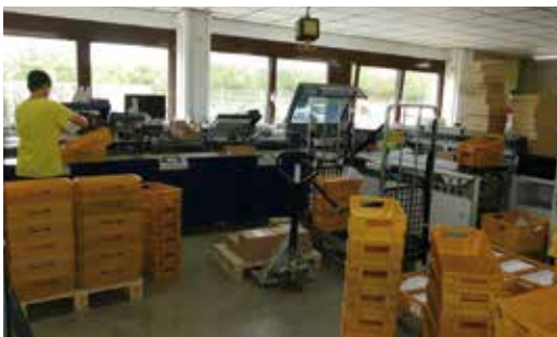
Bei der Porttoptimierung oder anschließenden Kuvertierung bringt Wolanski seine jahrzehntelange Erfahrung ein.

Wolanski www.wolanski.de profi-tec www.profi-tec.com