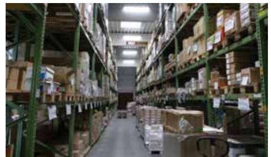
Für Wolanskis Fulfillment-Angebot steht ein großes Lager zur Verfügung, das Kunden viel Arbeit abnehmen kann.